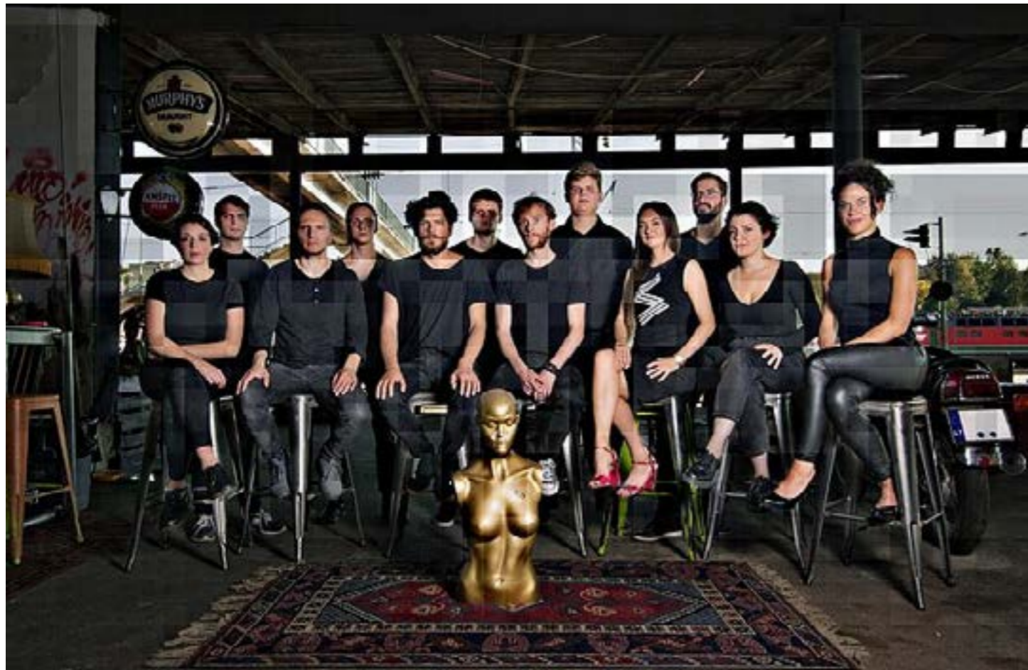
Šiuolaikinės muzikos ansamblis „Synaesthesia“

K. Dirsė: – Buvo labai smagu, nepaisant to, kad filmavome teatre, kur buvo 10 laipsnių šalčio, o juk buvo scenų su maudymosi kostiumėliais – teko pašalti. Manau, kad atlikėjams buvo išbandymas, bet dirbti buvo labai lengva, nes tai žmonės, kurie, visų pirma, yra muzikantai, bet, iš esmės – menininkai bendrąja prasme. „Synaesthesia“ labai atviras, plačiai žiūri į meną, nėra tipinis, klasikinis ansamblis. Buvo smagu, nors kartais pamainos pabaigoje matydavau, kad jie nesitikėjo, jog užtruks taip ilgai ir bus tiek darbo. Bet jiems turėjo patikti. Man irgi patiko.