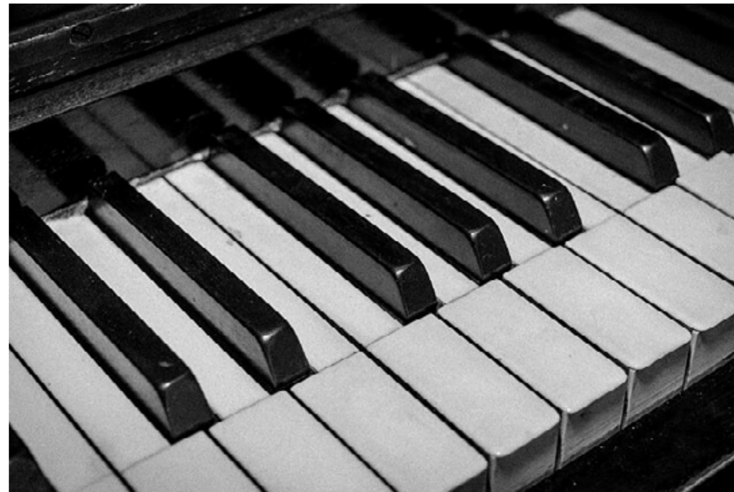
Pianinas/Muzika / Unsplash.com nuotr.

K. Dirsė: – Juodai balta estetika atėjo iš mūsų ankstesnių darbų, tad dėl jos klausimų nekilo. Naudojome senojo kino metodus, galinę projekciją – techniką, kuri buvo paplitusi dar iki specialiųjų efektų. Man svarbu, kad žiūrovas pajustų, kad stebi tikrų žmonių tikrus atsiminimus. Ilgai galvojau, kaip išgauti dokumentiškumo pojūtį, nesukeliant vaizdo ir muzikos disonanso. Bandžiau naudoti teksto įrašus, kad būtų girdėti pasakojančių personažų balsai, nes dalis filmo išties yra intymus atsivėrimas. Tačiau galų gale radome sprendimą įdėti tekstą taip, kaip būdinga nebyliajam kinui.