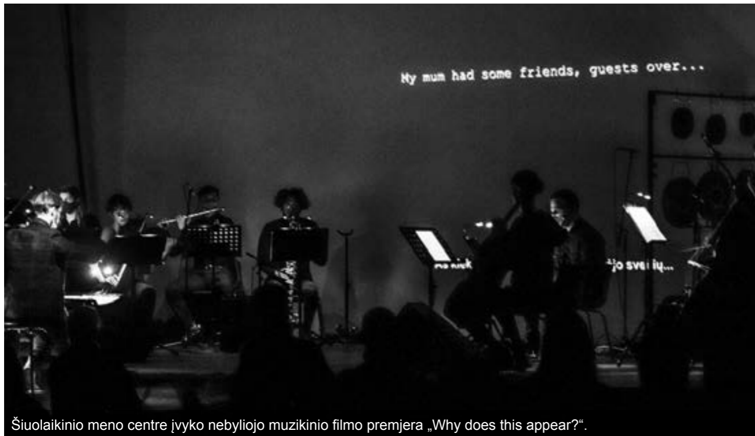
Šiuolaikinio meno centre įvyko nebyliojo muzikinio filmo premjera „Why does this appear?“.