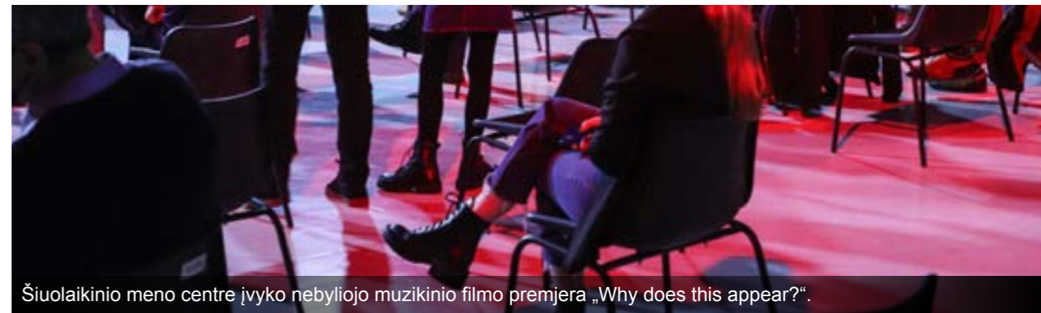
Šiuolaikinio meno centre įvyko nebyliojo muzikinio filmo premjera „Why does this appear?“.