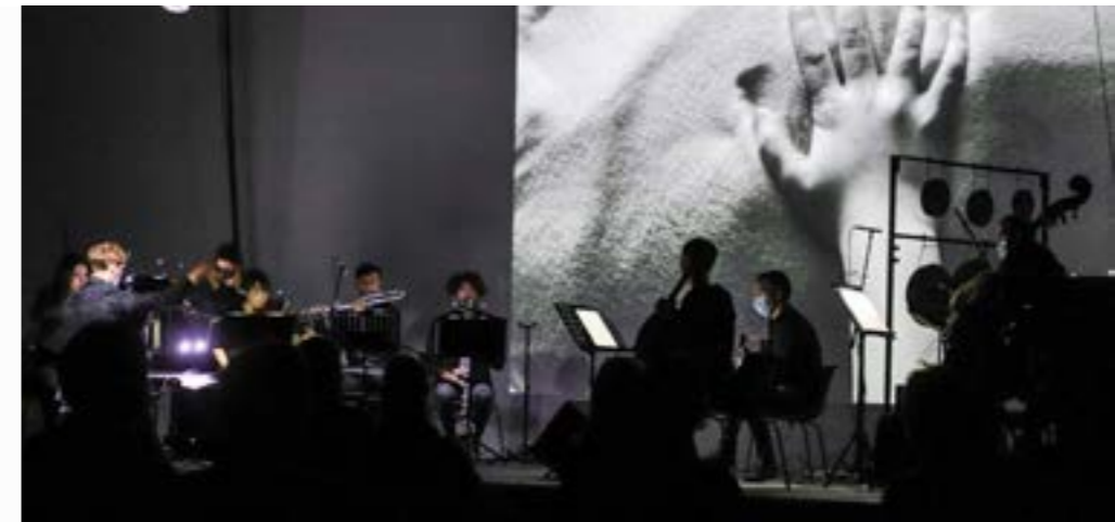
Ansamblis „Synaesthesia“ projekte „Why does this appear“.