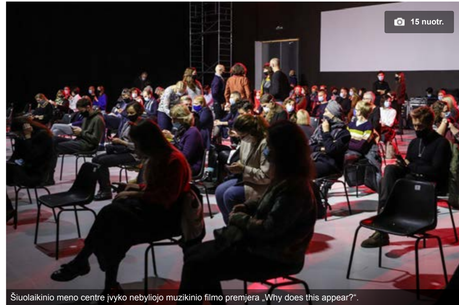
Šiuolaikinio meno centre įvyko nebyliojo muzikinio filmo premjera „Why does this appear?“.

Filmas „Why does this appear?“ yra poetiškas, garsinis ir vizualus darbas apie žmogaus prisiminimus – realybės, kurioje gyvename, suvokimą ir slidžią ribą tarp jos ir iliuzijos. Vienu sakiniu neįmanomą nusakyti visų minčių, kurias šis kūrinys sukelia, nes kiekvieną kartą apie jį galvojant, galima nuklysti skirtingais keliais ir prieiti skirtingų išvadų. Kūrinys kiekvienam žiūrovui, kuris jį subjektyviai patirs ir vertins, sukels vis kitas emocijas, mintis, mat filmas yra nebylus ir nespalvotas, o teksto jame irgi nėra daug.