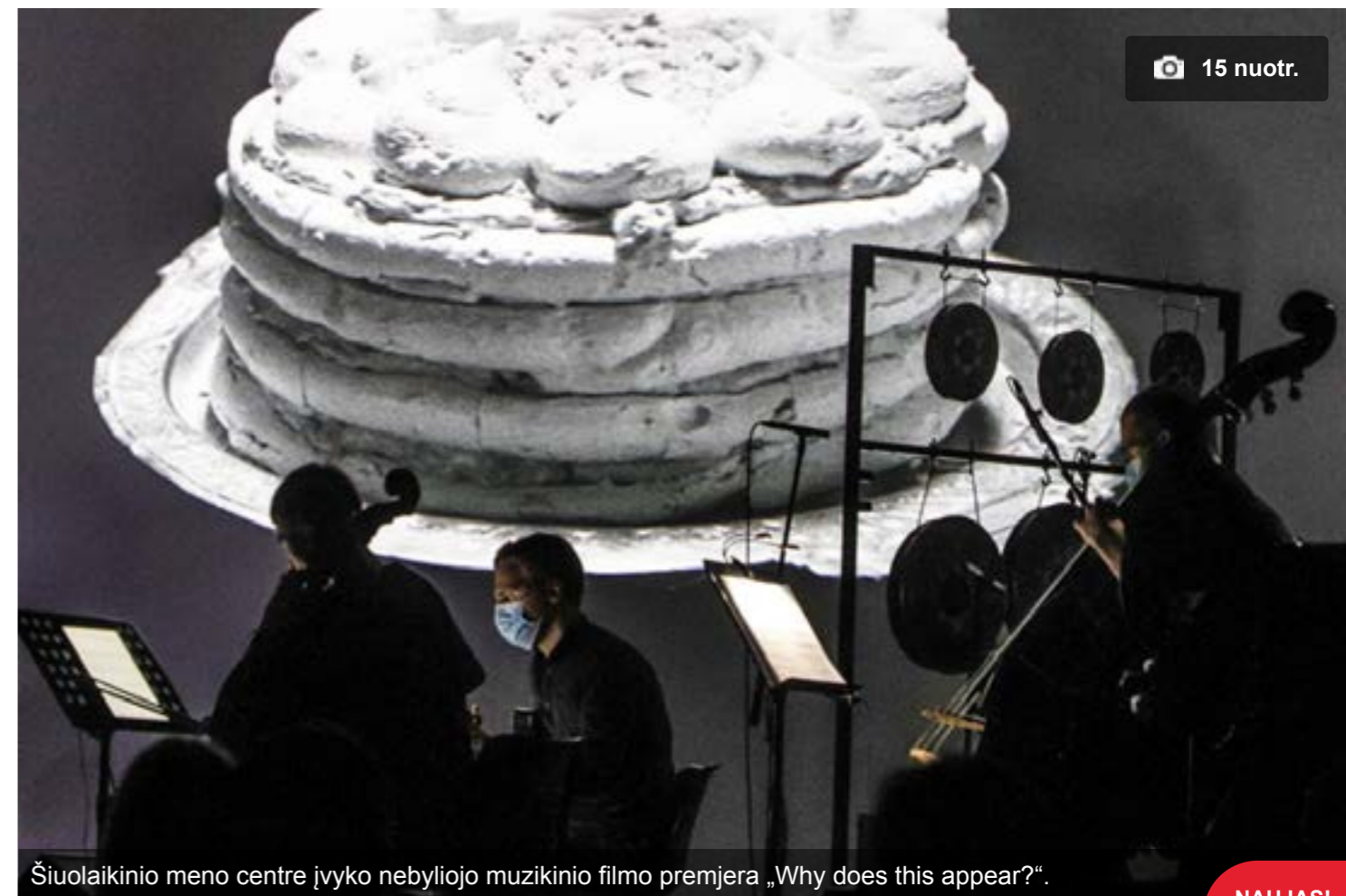
Šiuolaikinio meno centre įvyko nebyliojo muzikinio filmo premjera „Why does this appear?“.

Apibendrinamas norėčiau pasidžiaugti, kad lietuviškos muzikos padangėje randasi įvykių, kurie gali varžytis su užsienio kultūros eksportu. Jei „Why does this appear?“ bus kartojamas, nuoširdžiai rekomenduoju aplankyti. Juk įdomu pamatyti ansamblį, atliekantį gyvą muziką nespalvotam ir nebyliam filmui.