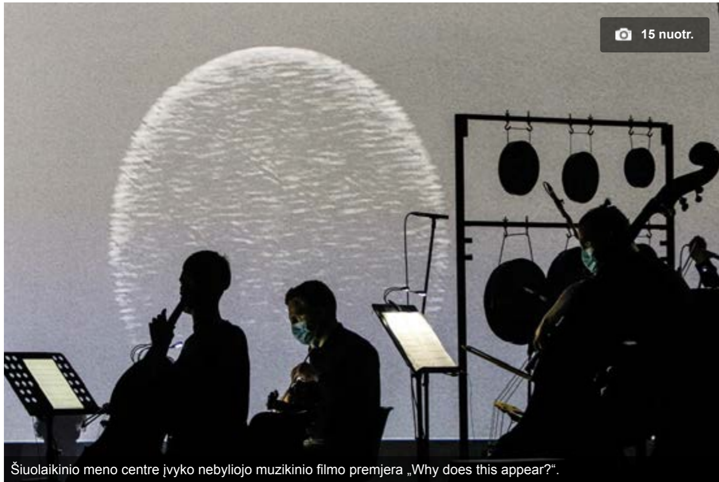
Šiuolaikinio meno centre įvyko nebyliojo muzikinio filmo premjera „Why does this appear?“.

Bet turiu pripažinti: kartais taip susidomėdavau istorija ekrane, nors ir nebylia, ir taip užsižiūrėdavau į kiną, kad apie muziką pamiršdavau, nors ją ir girdėjau. Filmo eigoje atrodė, kad muzika atlieka labiau palydimąją funkciją ir kad ji nėra lygiavertė vaizdo partnerė.