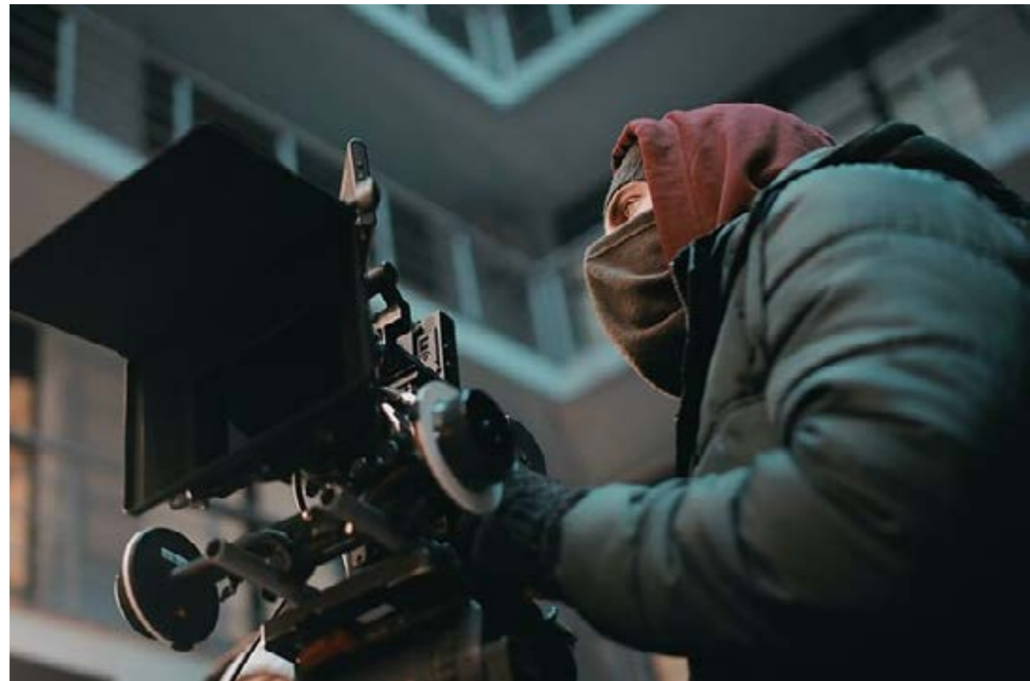
Filmavimo kamera