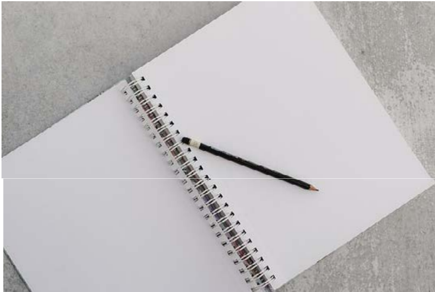
Rašymas/užrašai/planavimas