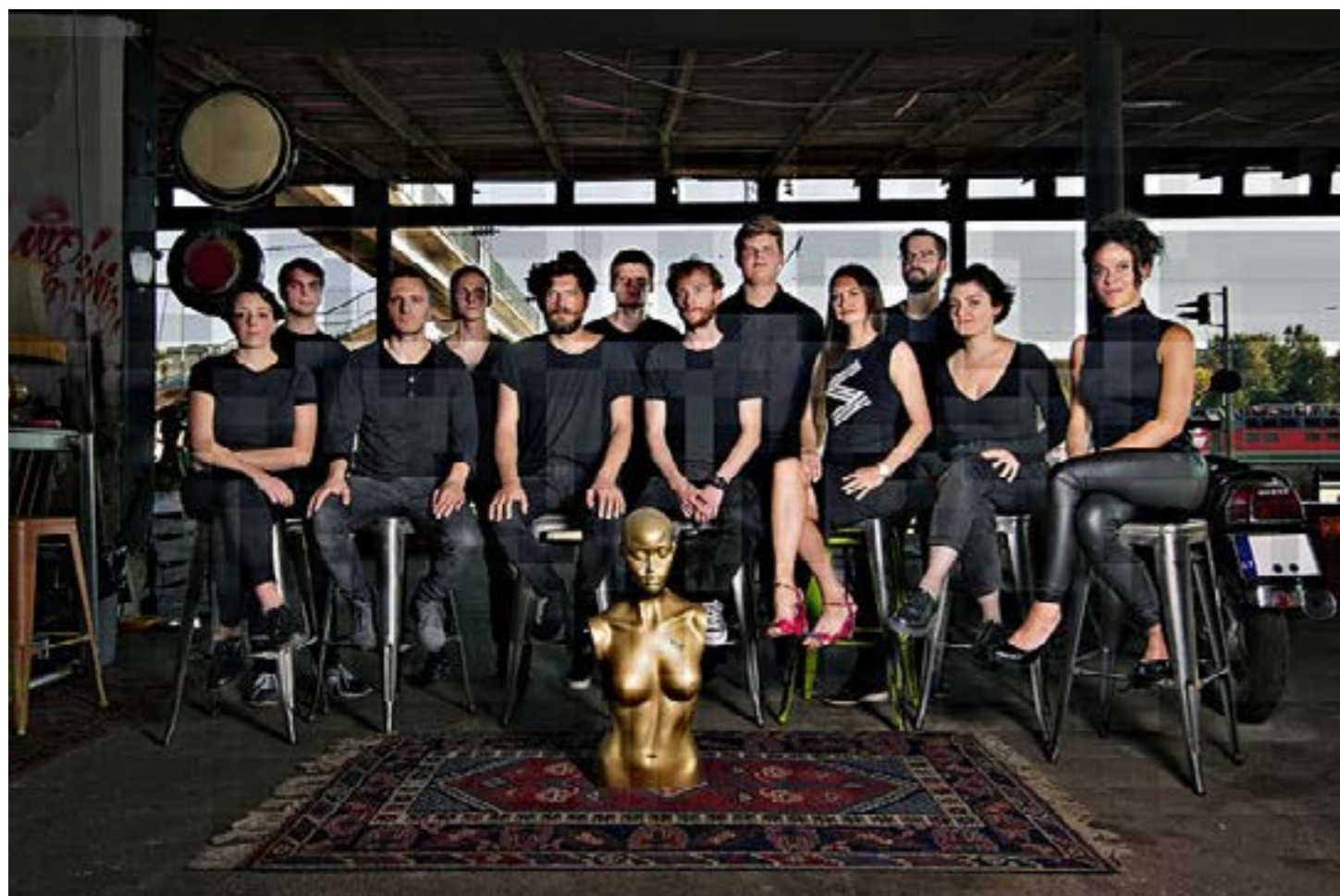
Šiuolaikinės muzikos ansamblis „Synaesthesia“.

Vilniaus miesto šiuolaikinės muzikos ansamblis „Synaesthesia“ buvo įkurtas 2013 m. kompozitoriaus D. Digimo ir dirigento K. Variakojo. Pagrindinė ambicingų jaunųjų atlikėjų misija – atlikti Lietuvos ir užsienio kūrėjų šiuolaikinės muzikos kūrinius, kreipiant dėmesį ne tik į garsą, bet ir kuriant atitinkamą pasirodymo erdvę, vizualiką, judesį ir pan.